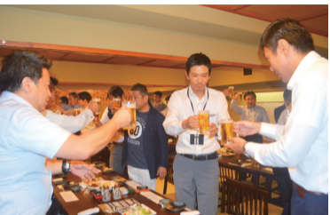
▲県内外から取引先33人が出席した交流会

同社は1998年設 立で社員数5人、年商 は3億6千万円。近年 は県内で複数のコンビ ニや飲食店、パチンコ 店開発を手掛けており、 昨年度からは新卒採用 をスタート。営業職を 募集している。